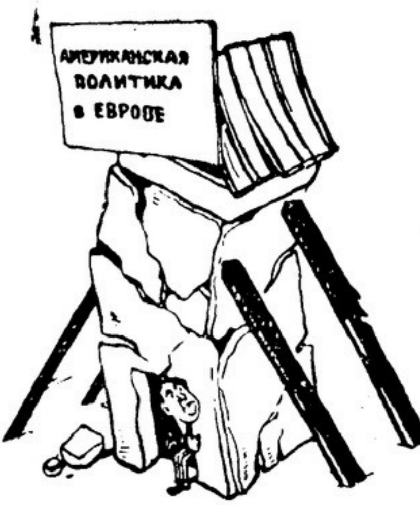
Рис. Бор. ЕФИМОВА